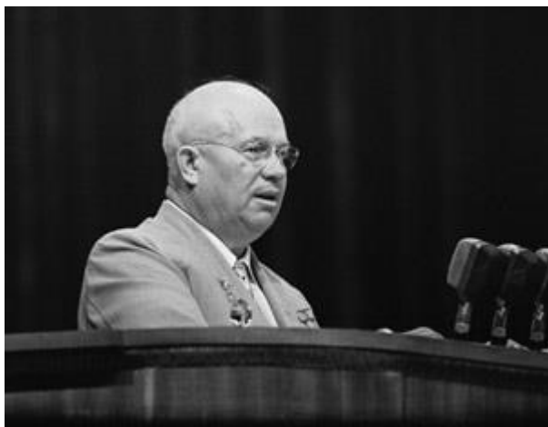
Текст: Дмитрий Лысков