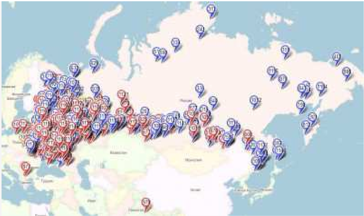
Рис. Распространение древнерусских топонимов: красным цветом показаны населённые пункты, синим - реки.

– Есть ли в грамотах имена людей? Тех, которые тогда жили.