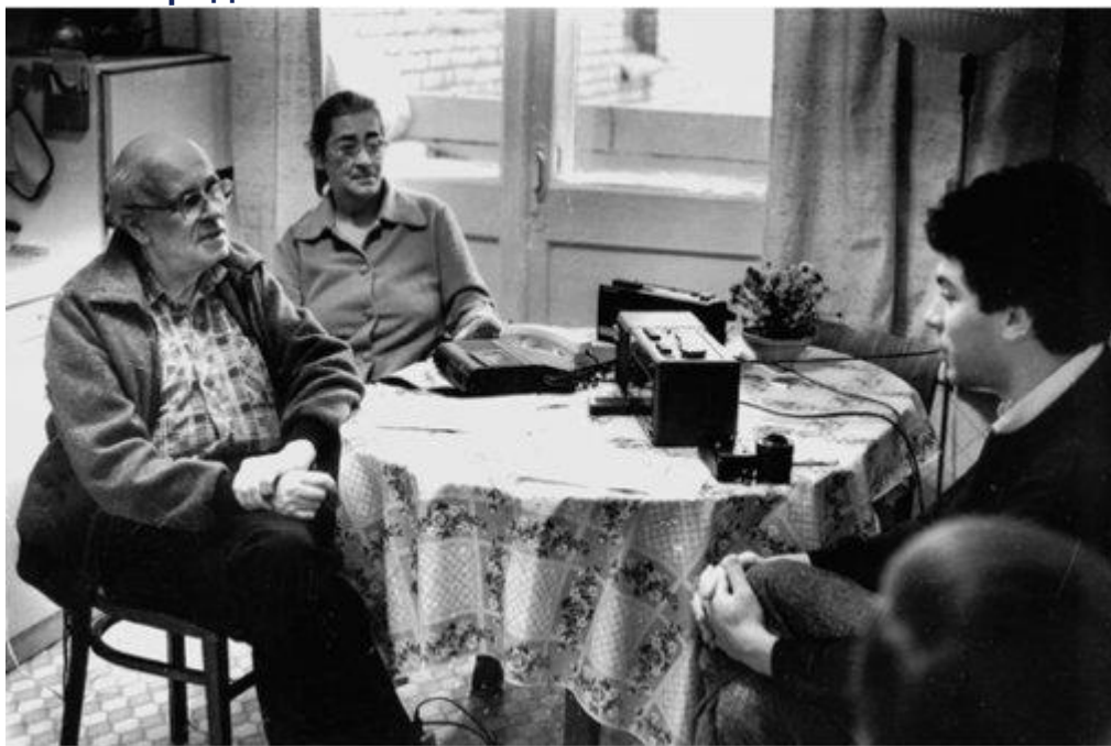
Немцов, Боннер, Сахаров. Горький, 1988

В разгар Перестройки Немцов сделался заводилой в местном экологическом движении, добиваясь остановки строительства Горьковской атомной станции теплоснабжения (ГАСТ). Впоследствии это решение привело к энергодефициту и негативно сказалось на экономическом развитии Нижнего Новгорода.