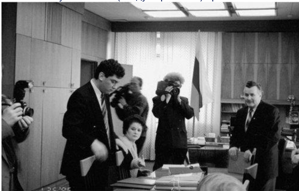
Немцов изучает собранные подписи против войны в Чечне. Январь 1996

В начале 1996, еще до Хасавюртовских соглашений, Немцов собирает в Нижнем миллион подписей за вывод российских войск из Чечни, что играет на руку "отползавшему" с Кавказа (ввиду поражения) Кремлю.