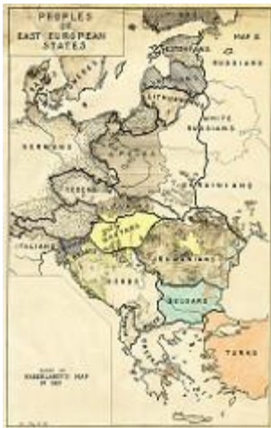
Этнографическая карта Восточной Европы