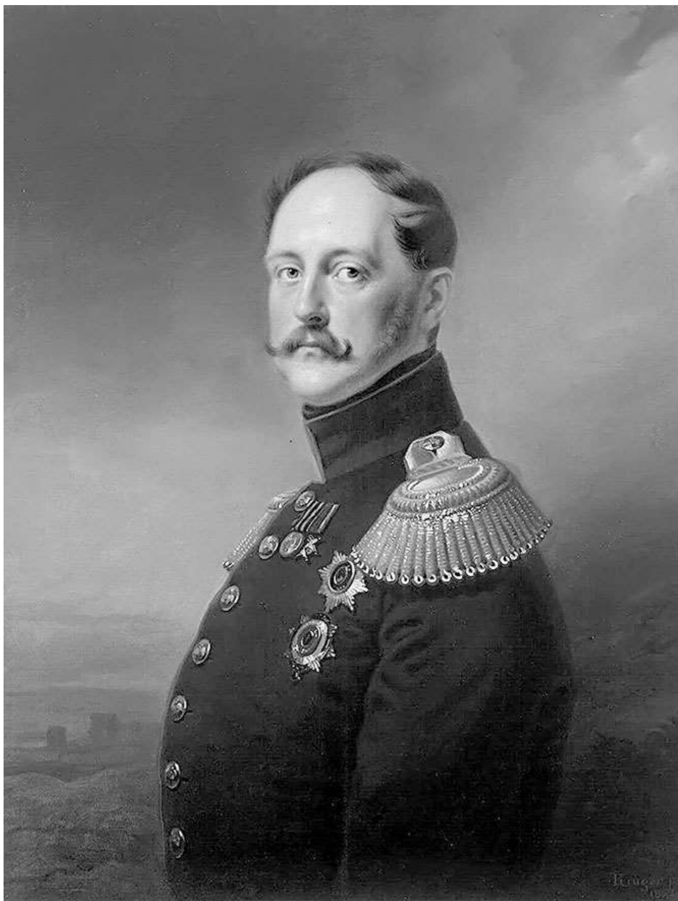
Николай I – император Всероссийский с 1825 по 1855 гг., царь Польский и великий князь Финляндский Художник Франц Крюгер