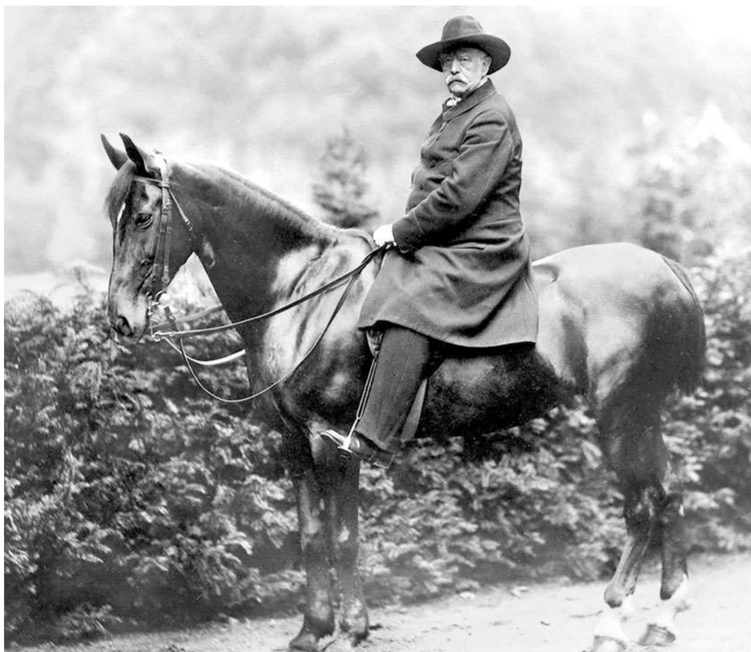
Отто фон Бисмарк. Фото 1890 г.

После отставки Бисмарк решил изложить свои воспоминания и издать мемуары. Бисмарк пытался не только повлиять на формирование своего образа в глазах потомков, но и продолжал вмешиваться в современную ему политику, в частности, предпринимал активные кампании в прессе. Нападкам Бисмарка чаще всего подвергался его преемник – Каприви. Косвенно он подвергал критике и императора, которому не мог простить свою отставку.