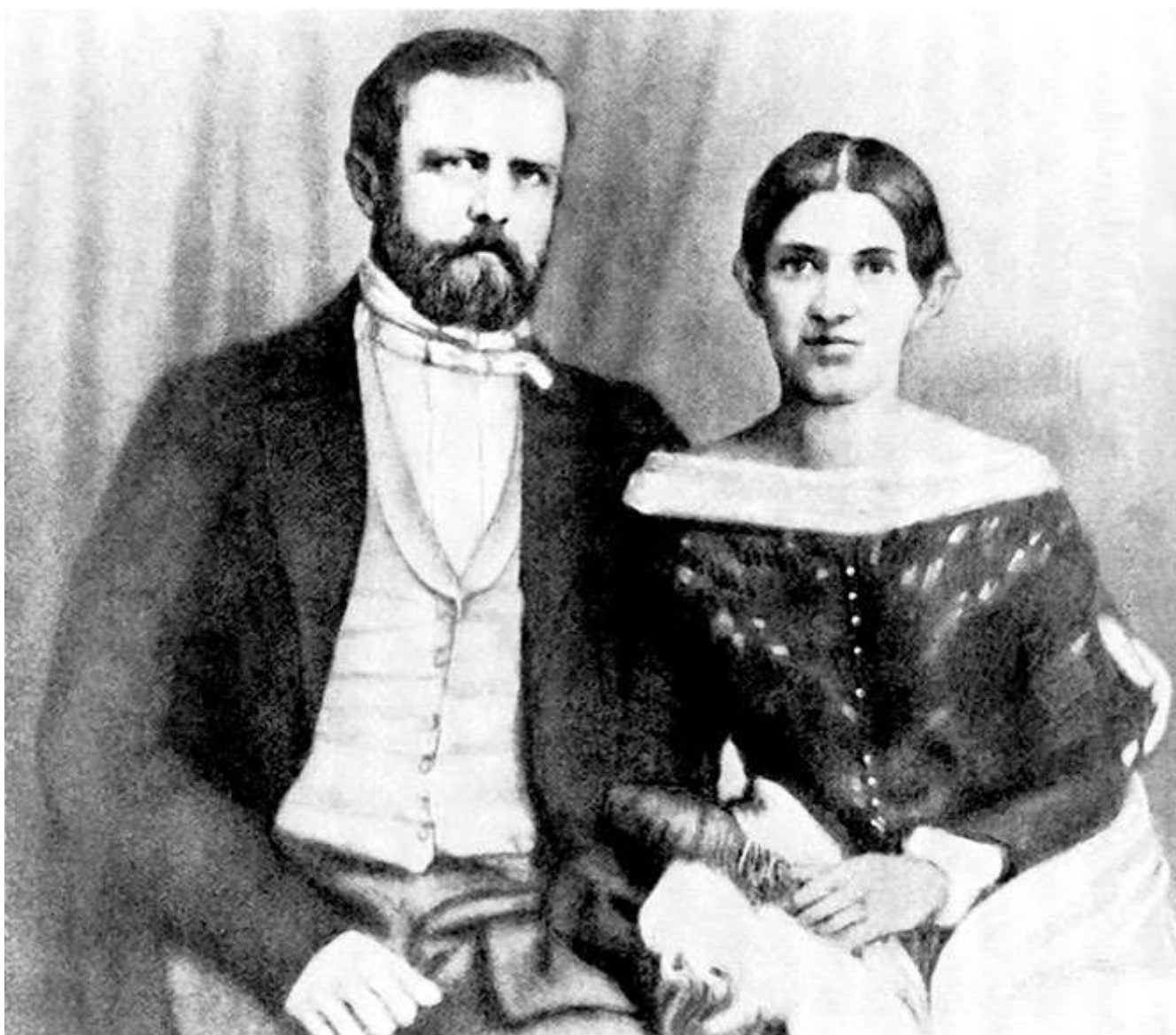
Бисмарк с супругой

Я отклонил это и, безуспешно испробовав в Берлине разные процедуры, проделал затем в Наугейме курс лечения ваннами под наблюдением марбургского профессора Бенекке и поправился настолько, что мог ходить и ездить верхом, а в октябре – даже и сопровождать принца-регента в Варшаву на свидание с царем.