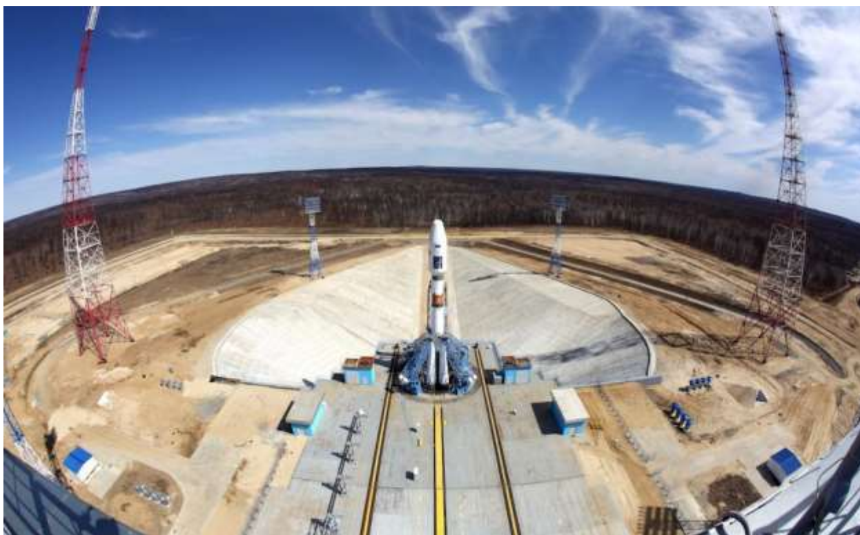
Космодром «Восточный»

— Построил бы, но предупредил, что это приведет к банкротству «Крокуса». Но он бы такого не предложил, он же уже лично говорил о том, что по нынешней смете никто не хочет работать.