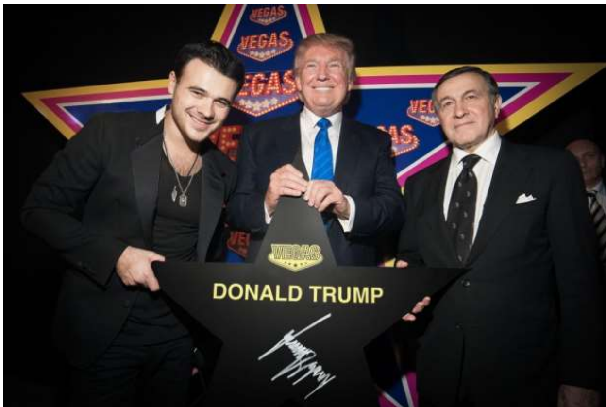
Эмин Агаларов, Дональд Трамп и Араз Агаларов.

— Я всегда догадывался, что там не все хорошо. Но в целом мало что изменилось, я понимаю, что нас просто использовала одна группировка, которая воевала с другой, демпартия воевала с Трампом. А в борьбе можно все использовать.