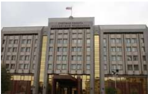
Счетная палата РФ

29.06.2019