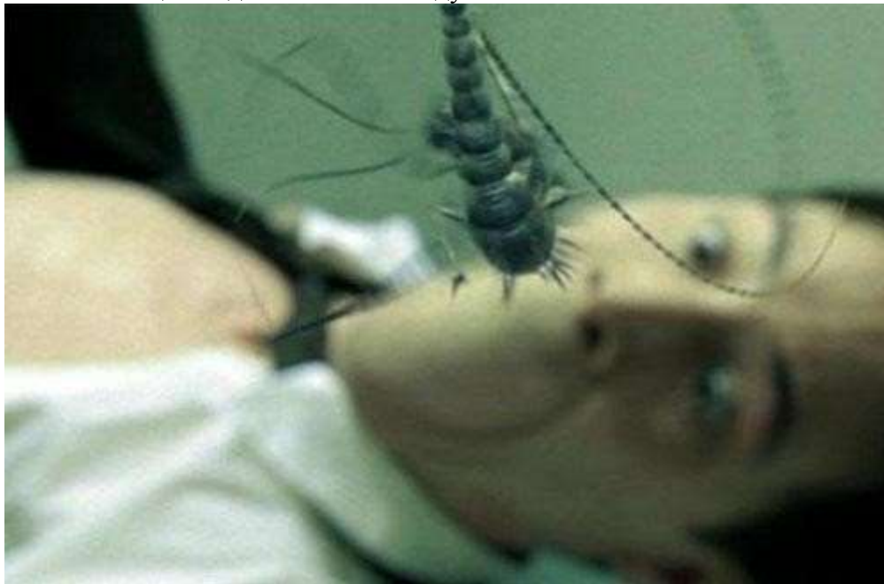
Внедрение "жучка" - фрагмент из кинофильма "Матрица"

выворачивание его наизнанку ещё при жизни с осознанием всей глубины порочности, причём, не только своей лично, но и своего рода и всего рода человеческого. Это и есть то самое «умное делание», которым занимаются все духовные подвижники, прорабатывающие через покаяние, исихию и молитву личный, родовой и первородный «грехи», понимая всю важность этого титанического труда по перепросмотру, переосознанию и переосмыслению всей своей жизни и каждого поступка. Вот какой ценой даётся спасение души.