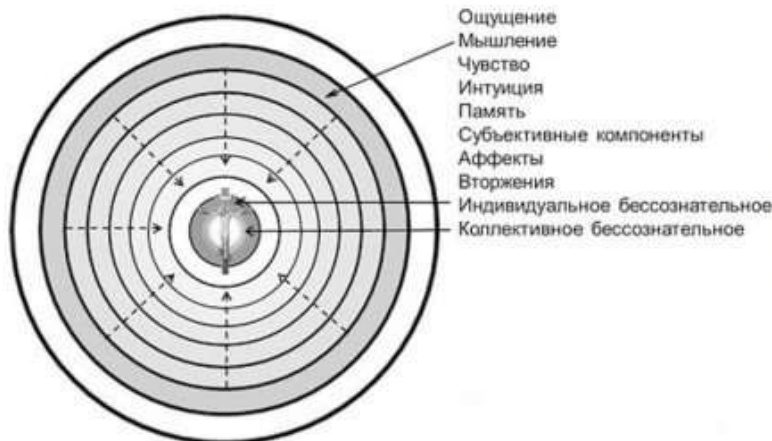
Модель психического бытия по К.Г. Юнгу