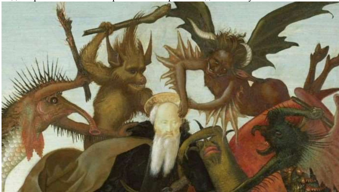
Искушение святого Антония бесами

Для осознанного человека - это в действительности страшная и шокирующая правда о нашем высшем предназначении в качестве «пищи богов», которую они возвращают под покровом нашего материального мира повседневной суеты.