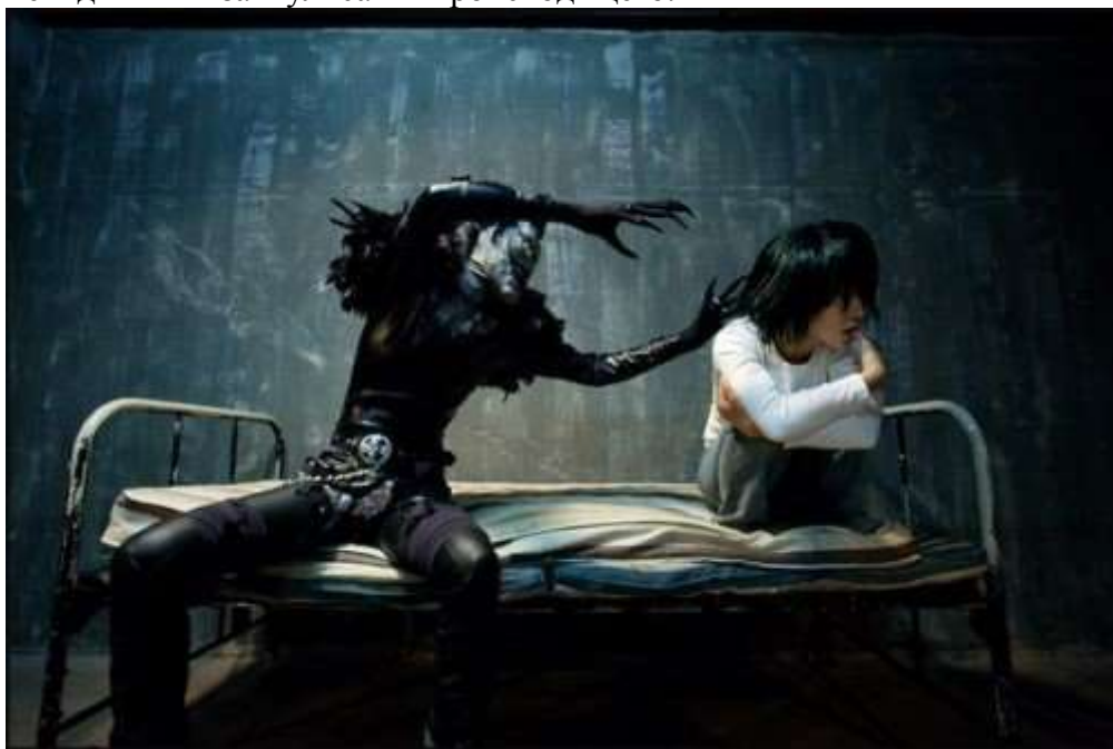
Бес искушающий душу

Третьей проблемой нашего освобождения, кроме нашего незнания и бессилия является наша лень и страстность с патологическим нежеланием меняться и стремиться к духовному совершенству и бесстрастному сознанию. Современный человек – это патологический эгоист и лентяй, который озабочен исключительно своим статусом, здоровьем и материальным положением в жизни и которому до поры нет никакого дела до духовного знания и смысла цитаты «...там будет плач и скрежет зубов». А самим духам и бесам только этой слепоты и этой невнимательности и нужно. Именно поэтому они успешно манипулируют нами через ум, чувства и эмоции, а мы этого не чувствуем и списываем на всё что угодно – от спонтанной раздражительности и нервозности – до несчастного случая, исключая при этом роль и участие во всём этом главных наших «кукловодов», которые всегда остаются невидимыми за кулисами происходящего.