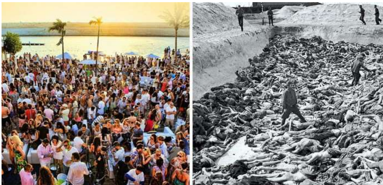
Две стороны жизни и мира

Именно поэтому их нельзя осуждать, поскольку в силу ряда причин они просто не способны понять всей сложности духовных механизмов и инструментов. Их невежество и простота позволяют им жить простой инстинктивной и полуживотной жизнью, которая не отягощена осознанностью вообще и осознанностью духовной в частности.