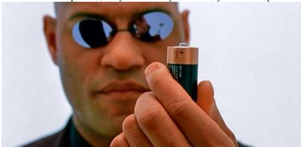
Фрагмент из кинофильма "Матрица"

Только очень немногие люди из общего числа пребывающих в прекрасной иллюзии материального бытия, осознают то, что под внешней оболочкой объектной эго реальности нашего мира скрывается другой мир невидимый и он совсем не так дружелюбен к нам, в действительности, как многие полагают, а использует нас как «батарею», которая может генерировать и обеспечивать постоянный источник психической энергии для существ и сущностей духовного мира.