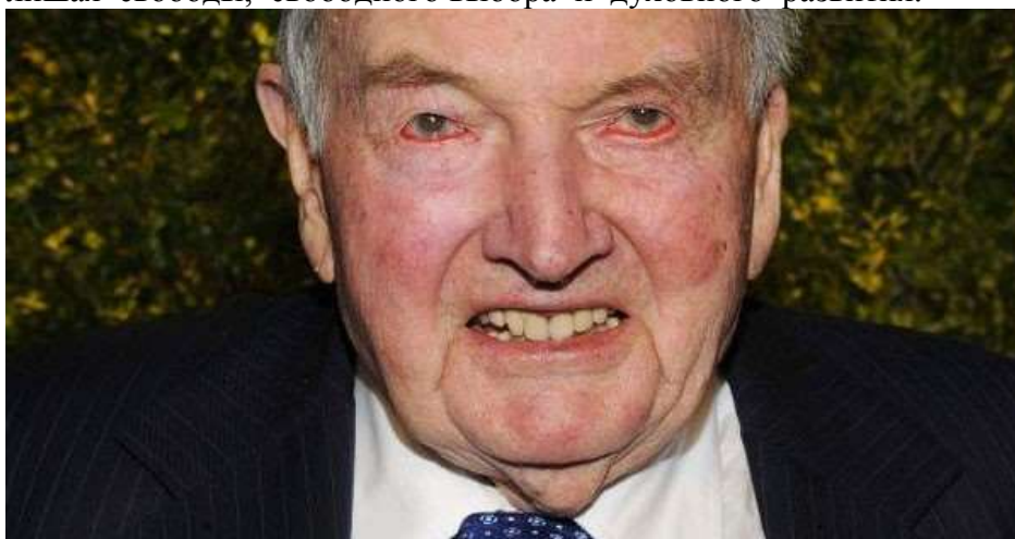
Дэвид Рокфеллер, как олицетворение супер эгоизма

В этих условиях хищному сверх сознанию бесов и злых духов ничего иного не остаётся, как использовать иллюминатов и олигархат в роли своих агентов влияния на земле, которые буквально создают в мире демоническую среду и утверждая эгоизм и соперничество готовят весь род человеческий для скармливания бесам, лишая свободы, свободного выбора и духовного развития.