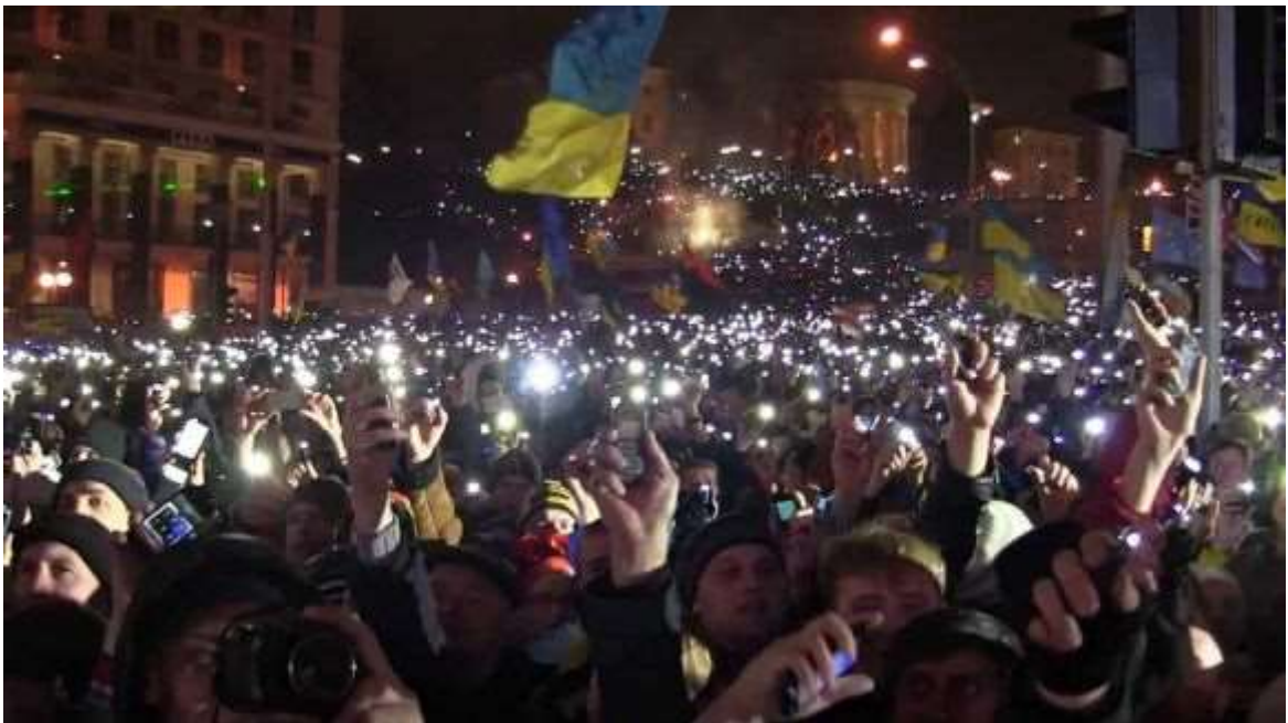
Киев 2014 г.

На протяжении нескольких дней в Екатеринбурге было особенно видно применение западных методов раскачивания ситуации в обществе, которые уже хорошо отработаны на протяжении нескольких десятилетий в разных странах мира, в том числе и на Украине в 2014 году, где Запад праздновал победу над успешной реализацией проекта по свержению неугодного Виктора Януковича. Более чем, можно быть уверенным, что протестные акции в Екатеринбурге были оплачены за счёт западных фондов, которые выделяют миллиарды долларов США на подобные мероприятия по свержению власти. Екатеринбург был выбран ими не случайно, поскольку здесь есть предпосылка для начала сепаратизма и нарушения территориальной целостности России как единого государства. На территории Свердловской области в одно время поднимался вопрос о суверенитете и создании отдельного государства под названием "Уральская республика", в связи с чем даже был придуман атрибут "нового" государства – флаг.