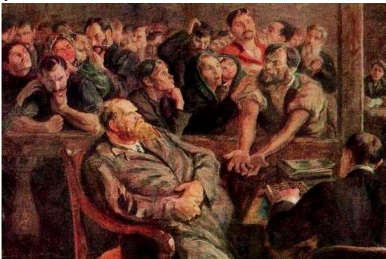
Николай Верхогуров. Расчёт (Перед стачкой). 1910

Повышение налогов, на сборе которых, как нам сообщили, базируется экономический успех, убийственная пенсионная реформа (в которой самое страшное то, что работающие пенсионеры остаются без пенсии), неконтролируемый рост цен — это лишь видимые отблески дьявольского костра, разгоревшегося в России.