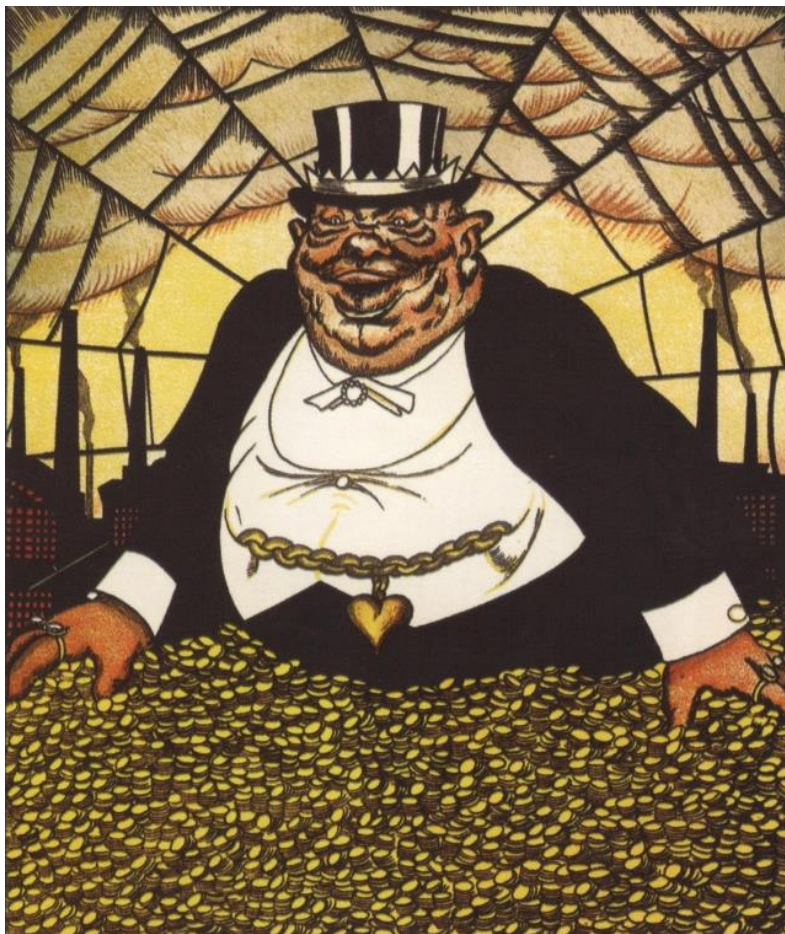
Виктор Дени. Капитал. 1920

составляет 51%, в Бразилии 43%, Китае и США 33–35%, Италия, Великобритания, Канада — 25%, Франция 20%, Япония 19%), и мобилизуется для кремлёвских нужд».