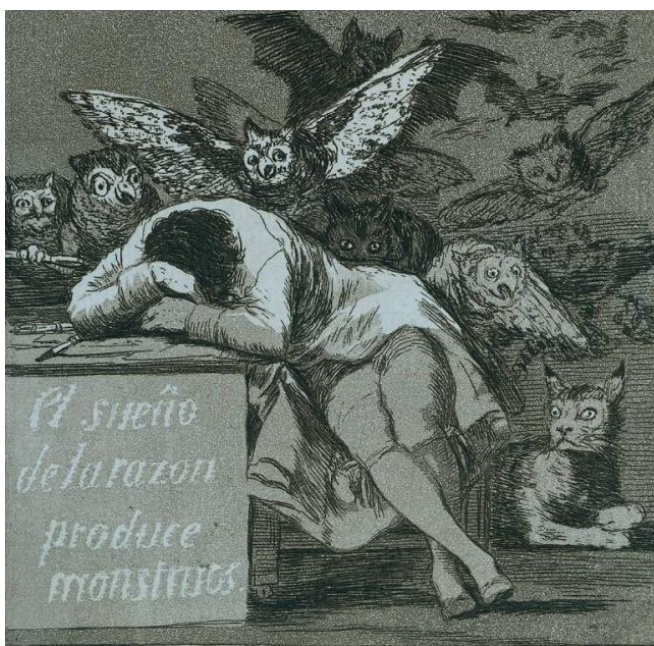
Франсиско Гойя. Сон разума рождает чудовищ (фрагмент). 1797