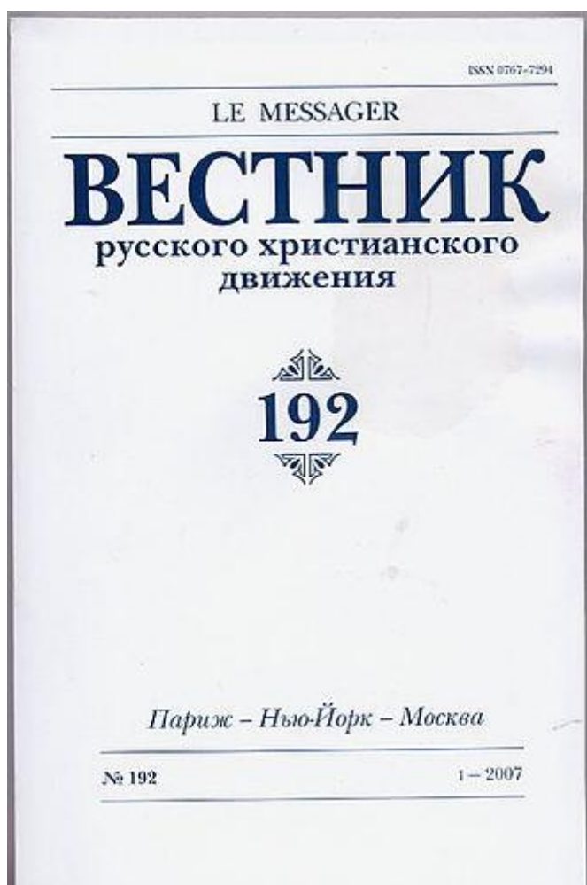
Обложка журнала: "Вестник Русского Студенческого Христианского движения"

Внимание, совершенно секретное "распоряжение Ленина", с пометкой не снимать копий, впервые появляется, в Париже в журнале "Вестник Русского Студенческого Христианского движения" за 1970 год, на основании собственного экземпляра "письма". Иностраный журнал, располагает копией, совершенно секретного письма!