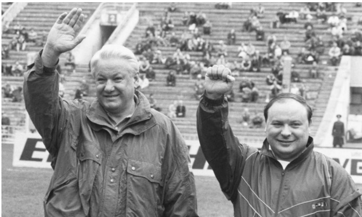
Фото. 1. Президент России Борис Ельцин и и. о. Председателя Правительства Егор Гайдар передают привет из далекого 1992 года. По мнению экспертов материальный ущерб России от их деятельности с 1992 по 1998 год в 2,5 раза превысили потери Советского Союза во Второй мировой войне, а людские потери – 12 млн. человек.

Первый факт. В 1992 году американцы настояли, чтобы рыночные реформы были проведены Егором Гайдаром. Одновременно в Правительстве России во все ключевые министерства были введены десятки экономических советников, которые, как оказалось потом, назывались «экономическими убийцами». Американцами в России с помощью Гайдара была осуществлена программа под названием «Вашингтонский консенсус», используемая МВФ для разрушения экономики стран и превращения их в сырьевой придаток американских корпораций.