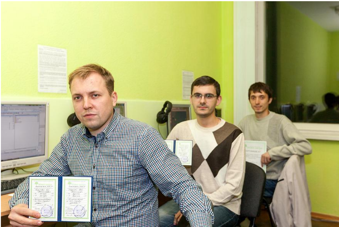
Дипломы об окончании курсов программирования на Java, базовый уровень

По определению, мошенничество — это получение чужих денег путём обмана или злоупотребления доверием. Образовательные сообщества и «курсы» берут деньги за то, что в интернете доступно бесплатно. Если от людей умышленно скрывают информацию, что многочисленные образовательные материалы бесплатно доступны в интернете, и в то же время эти материалы предлагают им за деньги — то это явное мошенничество, даже если находятся желающие купить доступ или пройти курсы образования.