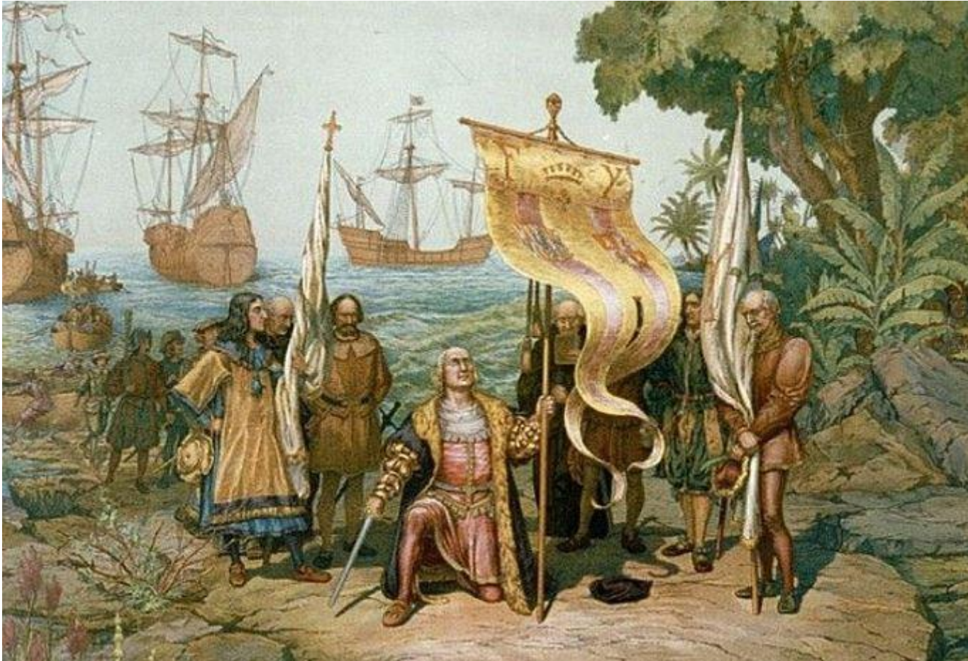
Высадка Колумба в Америке

Смерть Колумба в 1506 г. была почти незамеченной – к тому времени его слава померкла. Лет через 20 после его смерти началось превознесение заслуг мореплавателя. В Америке и поныне отношение к нему неоднозначно: День Колумба отмечается не только парадами, но и массовыми демонстрациями протеста, во время которых первооткрывателя называют колонизатором и несут его портреты с надписью «убийца».