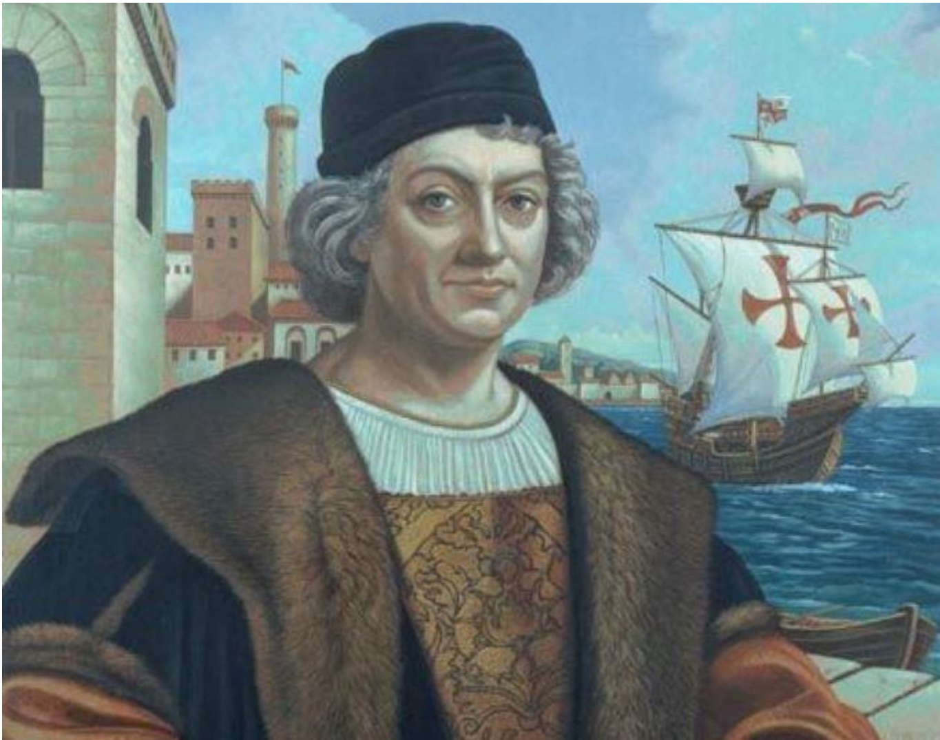
Великий первооткрыватель или жестокий колонизатор?

Свои заслуги Колумб не просто оценивал по достоинству – он требовал назначить его вице-королем новых земель. Король Фердинанд считал эти амбиции чрезмерными, хотя мореплаватель вносил немало выгодных предложений. Так, например, он предложил отправлять на заселение новых земель не вольных граждан, а преступников, что сокращало расходы на их содержание в тюрьмах. Однако у этой медали была и обратная сторона: уголовники нередко поднимали бунты против властей поселений.