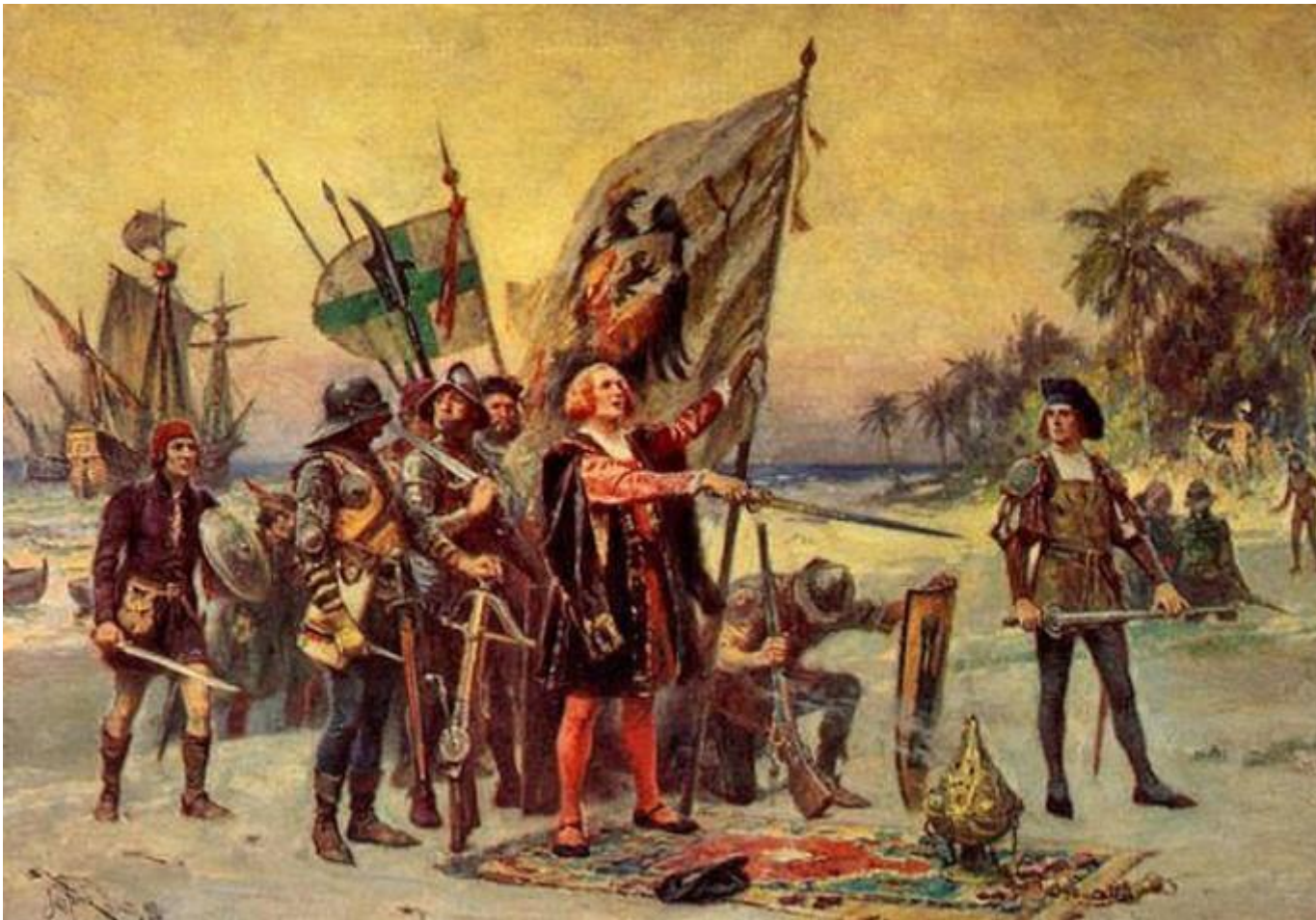
Ж. Л. Ж. Феррис. Прибытие Колумба в Америку

В своем отчете о первой экспедиции он утверждал, что достиг берегов Азии (на самом деле это была Куба) и острова недалеко от побережья «Китая» (Гаити). Ему не удалось найти богатых золотых месторождений, но местных жителей вывезли в Испанию в качестве рабов: отобрали 500 самых крепких аравакских мужчин и женщин, 200 из которых погибли в пути. Отношение к оставшимся в колонии местным жителям было крайне жестоким: мужчины гибли на рудниках, а женщины – на плантациях.