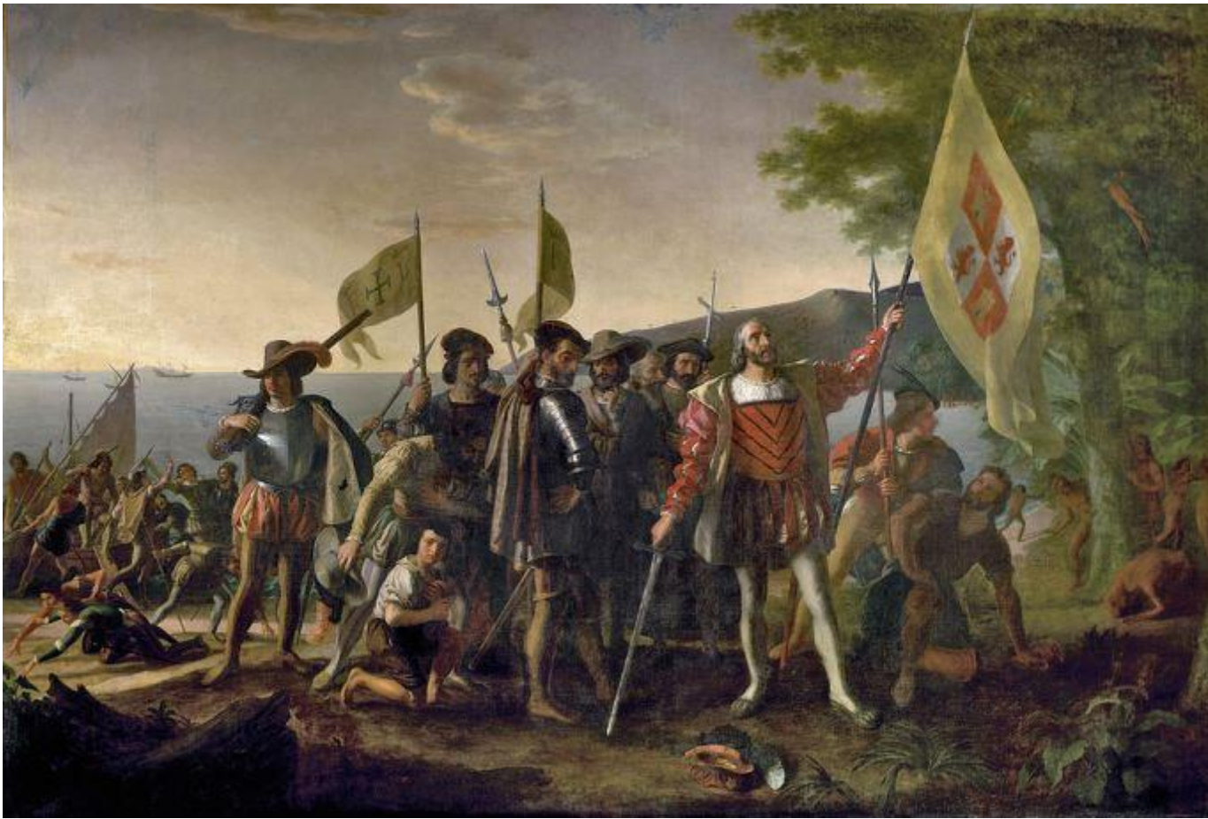
Д. Вандерлин. Высадка Колумба в Америке, 1847

Самой известной ошибкой Колумба была уверенность в том, что он достиг берегов Азии. Однако мореплаватель ошибся в своих вычислениях – Азия была как минимум в 3 раза дальше, чем он предполагал, а на его пути возник новый континент. В Южной Америке задолго до Колумба бывали норманны, однако колонизация континента началась именно с его экспедиций. При этом в испанской колонии на Гаити он установил суровые порядки: любые восстания жестоко подавлялись, при этом он не щадил ни местное население, ни испанских поселенцев. Колонисты даже пожаловались на Колумба испанскому королю. Королевский Комиссар арестовал мореплвателя и привез его в Испанию в кандалах. Однако король Фердинанд не только освободил Колумба, но и профинансировал его четвертую экспедицию в Новый Свет.