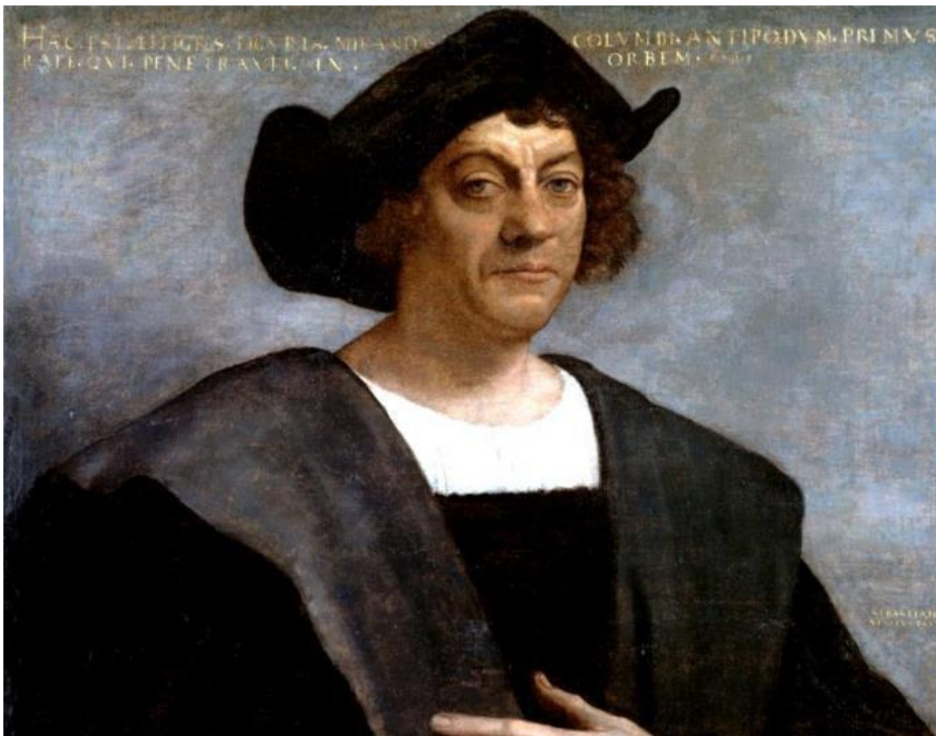
С. дель Пьомбо. Портрет Христофора Колумба, 1519

В биографии Христофора Колумба больше белых пятен, чем достоверных фактов. Его имя окружено легендами, он остается одной из самых загадочных фигур в истории. До недавних пор о нем писали исключительно как о великом первооткрывателе, но в последнее время появляется все больше исследований, в которых ученые предлагают взглянуть на него с другой стороны. Так, американский историк Говард Зинн уверен: появление в Новом Свете европейских поселенцев ознаменовало начало массовой колонизации, работорговли и истребления коренных народов.