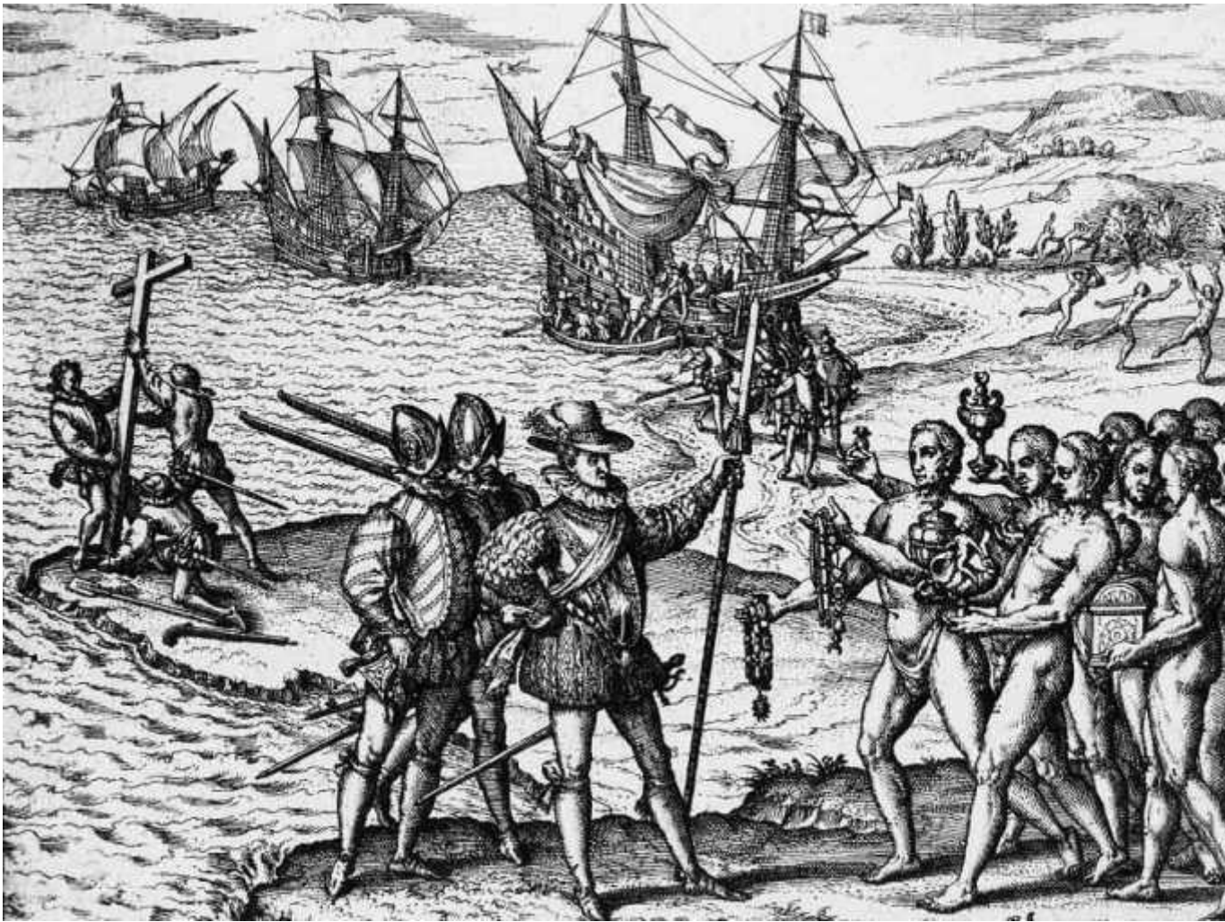
Прибытие Колумба на Эспаньолу (Гаити) в 1492 г.

Первым европейским поселением в Новом Свете (который Колумб называл то Индией, то Китаем, то Японией) стал Ла-Навидад («Рождество») на острове Гаити. В 1492 г. один из кораблей испанской эскадры потерпел крушение, команда добралась до берега, и Колумб принял решение оставить испанцев на острове, основав первое поселение. Запасы продовольствия были незначительными, но Колумб был уверен в том, что моряки без труда подчинят себе местное население. Когда через год мореплаватель вернулся на остров, он узнал, что аборигены убили всех поселенцев за плохое обращение с ними.